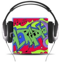
ΕΠΙΣΤΗΜΟΝΙΚΗ ΕΤΑΙΡΕΙΑ «European School Radio, Το Πρώτο Μαθητικό Ραδιόφωνο»