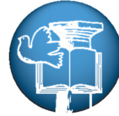
ΠΑΙΔΑΓΩΓΙΚΟ ΙΝΣΤΙΤΟΥΤΟ ΚΥΠΡΟΥ