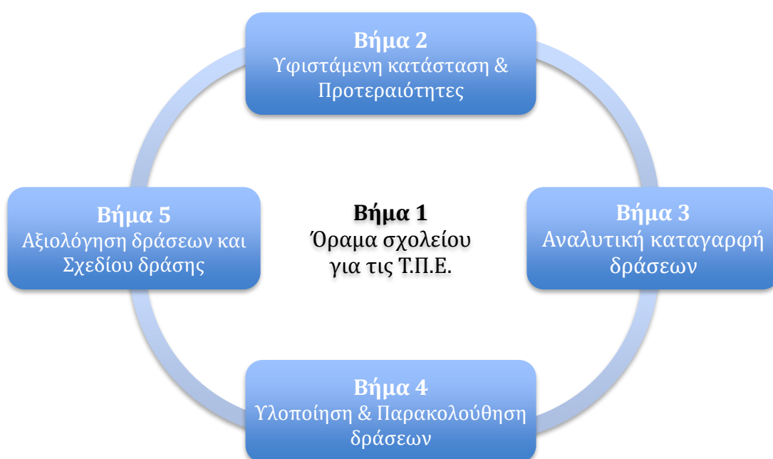
Διάγραμμα 2: Κυκλική διαδικασία Σχεδίου δράσης

Το Σχέδιο δράσης για τις Τ.Π.Ε. στοχεύει σε μια συνεχή προσπάθεια για την ανάπτυξη και διατήρηση ενός εκπαιδευτικού περιβάλλοντος που να είναι πρόσφορο για την κατάλληλη αξιοποίηση των Τ.Π.Ε. στην εκπαιδευτική διαδικασία. Με γνώμονα τον πιο πάνω στόχο, το Σχέδιο δράσης παίρνει τη μορφή μιας ανοικτής κυκλικής διαδικασίας, στο επίκεντρο της οποίας βρίσκεται το όραμα της σχολικής μονάδας για τις Τ.Π.Ε. (βλ. Διάγραμμα 2). Κατά τη διάρκεια της υλοποίησης του Σχεδίου δράσης, μέσα από την παρακολούθηση και αξιολόγηση του, μπορεί να υπάρξει αναπροσαρμογή ή/και διαφοροποίηση του αρχικού σχεδιασμού, ώστε να εξασφαλιστεί η επιτυχής ολοκλήρωσή του.