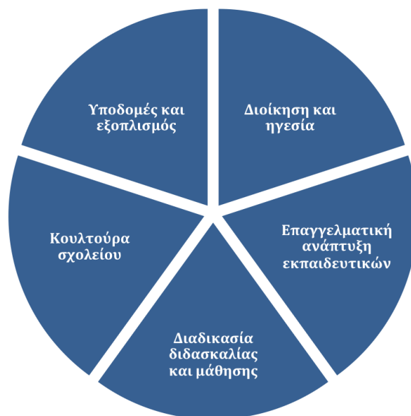
Διάγραμμα 1: Τομείς στους οποίους αναφέρεται το Σχέδιο δράσης για τις Τ.Π.Ε.

Οι πέντε αυτοί τομείς αναλύονται περαιτέρω στο Πλαίσιο αναφοράς για την αξιοποίηση των Τ.Π.Ε. που αναπτύχθηκε για το Πρόγραμμα (βλ. Ενότητα «ΒΗΜΑ 1: Αποτύπωση υφιστάμενης κατάστασης και ιεράρχηση προτεραιοτήτων»).